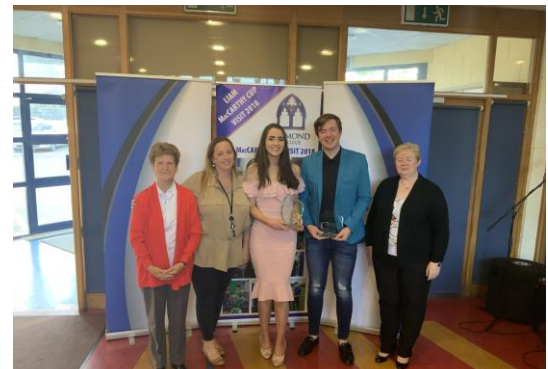
PLACE-EE participants and facilitators at the presentation of awards in Limerick, May 2019