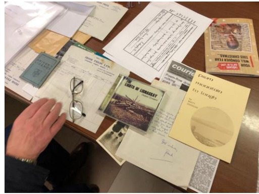
Historical artefacts in FODC

För mer information om LGNI: https://linkinggenerationsni.com/