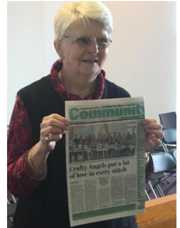
En PLACE-EE deltagare delade en kulturell ägodel i Limerick

Framgången med de första workshopen i Limerick har fortsatt, med i genomsnitt 21 yngre och 23 äldre deltagare som deltog i sexton workshops. Konversationsämnen fokuserade på lokalt arv, kunskap och kultur, vilket resulterade i att många berättelser, fotografier och minnen delades mellan generationer. Deltagarna diskuterade också hur föremål kan fångas digitalt för onlinearkivet och de fortsätter att arbeta tillsammans för att genomföra detta. För att komplettera PLACE-EE-workshops genomförde LCCC en serie IT-utbildningar för äldre, som har varit mycket framgångsrika.