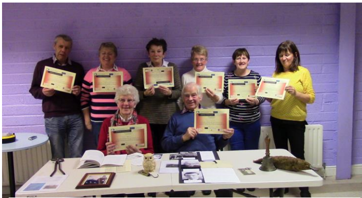
PLACE-EE participants with their certificates of achievement in FODC

För ytterligare information och uppdateringar om PLACE-EE-hackathon, se "Händelser" på webbplatsen och följ PLACE-EE på sociala medier. Information om webbplatsen och sociala medier listas på sidan 5.