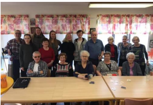
PLACE-EE participants in Fjarðabyggð

Äldre deltagare utforskade hur IT kan hjälpa dem i deras vardag och de tog med sig kaffe, hembakat och en mängd föremål och personliga berättelser att dela med sig av.