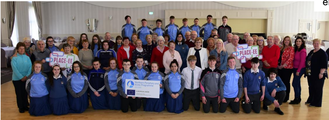
Alla deltagare och anordnare vid den sista intergenerationella workshopen i Limerick