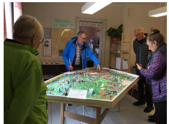
Seniorernas besök på Hembygdsområdet för att lära om den lokala historiken

Umeå universitet har avslutat utvecklingen av PLACE-EE Transnational Culture Archive och plattformen är nu redo för innehåll som ska laddas upp från vart och ett av demonstrationsområdena. Arkivet är redo att visas online i början av 2020 och detaljer om hur du kommer åt det kommer att inkluderas i nästa nummer av vårt nyhetsbrev