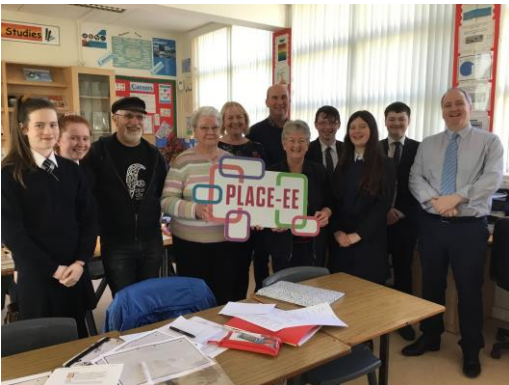
PLACE-EE participants in Dromore, County Tyrone

FODC: s VD Leza konsulterar för närvarande lokala seniorkluster för att förstå vilka kurser de vill ha i framtiden samt möter andra lokala grupper för att leverera IT-utbildning och minska social isolering. I nästa etapp av PLACE-EE planerar FODC också att arbeta med grundskolor i två ytterligare områden i distriktet.