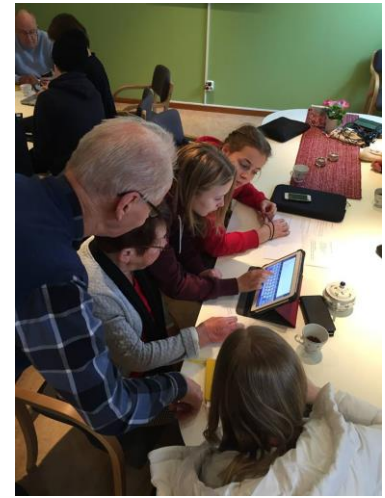
En ingergenerationell workshop i Skellefteå

Skellefteå Kommun har kört totalt elva workshops hittills och lockat 25 yngre deltagare och 10 äldre (i genomsnitt 8 äldre deltog i workshops). Deltagarna fortsatte att testa Virtual Reality under sina möten och studenter hjälpte de äldre med teknik i ett utsedd "teknikhörn". De diskuterade också onlinesäkerhet och lokal kultur och historia, ofta med fokus på den regionala dialekten "bondska". Efter sista workshopen firades det och alla uppskattade det.