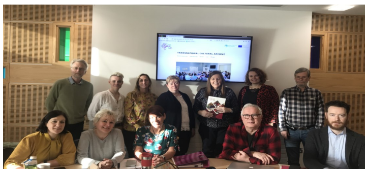
Þátttakendur á samstarfsfundi janúar 2020, Ulster háskóla

Lokaviðburður verkefnisins verður föstudagurinn 3. apríl 2020 í Belfast. Frekari upplýsingar verða aðgengilegar innan skamms. Lokafundur starfsverkefnisins verður 2. apríl 2020.