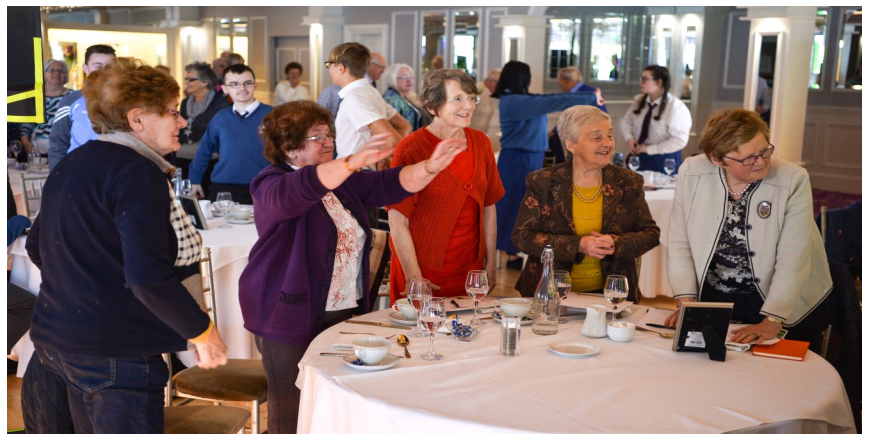
Participants in Limerick workshop 2019.

Teymi Ulster háskóla notar tækifærið til að þakka samstarfsaðilum, þátttakendum og öllum sem tóku þátt í þessu spennandi og tímabæra verkefni.