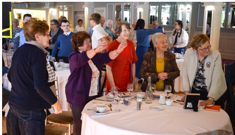
Participants in Limerick workshop 2019.

Teamet på Ulster Universitet tackar sina partner, deltagare och alla som deltagit med oss i detta spännande projekt.